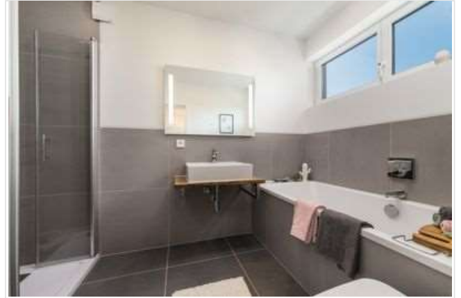
Bad mit Wanne und Dusche