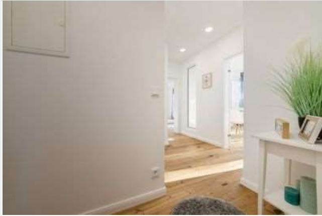
Flur / Diele