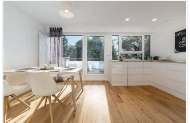
Esszimmer und Küche